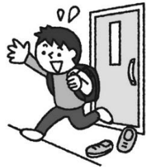
外出から戻ったとき