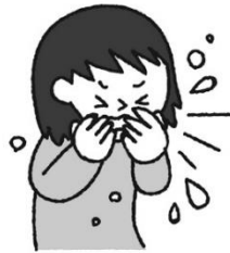
くしゃみや咳をした後