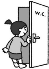
トイレに行った後